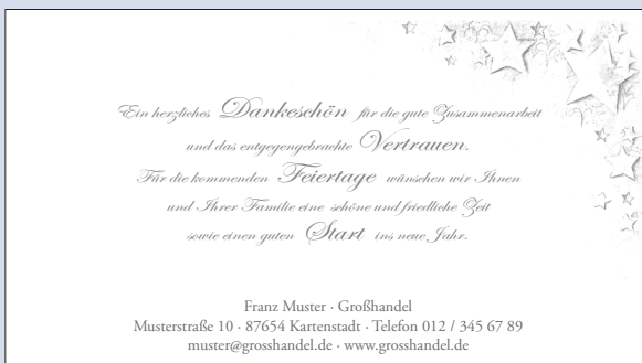
SONDERTEXT 7 | DEKOR 2