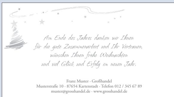
SONDERTEXT 21 | DEKOR 19