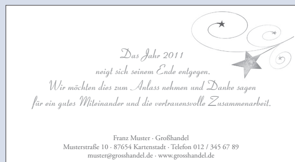
SONDERTEXT 25 | DEKOR 18