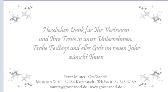
SONDERTEXT 22 | DEKOR 12