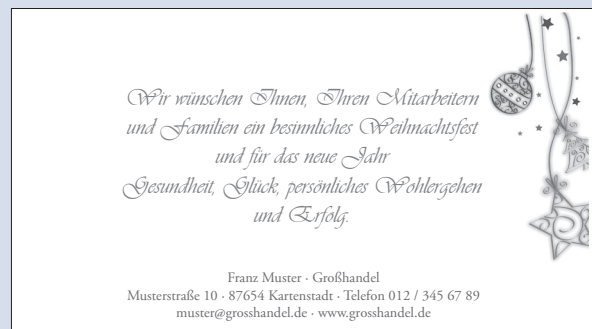
SONDERTEXT 24 | DEKOR 16