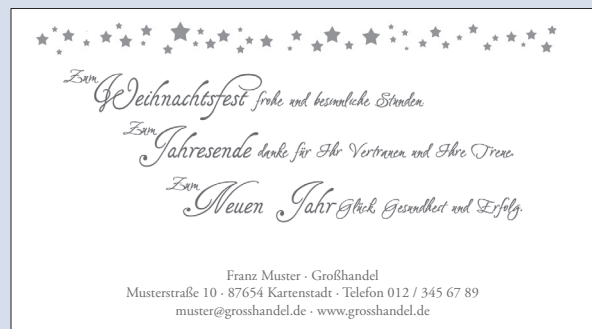
SONDERTEXT 23 | DEKOR 22