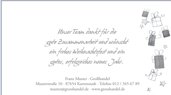
SONDERTEXT 1 | DEKOR 20

Schöne Dekoreindrücke und unsere grafischen Sondertexte werten die Innenansicht Ihrer virtuellen Weihnachtskarten gleich doppelt auf. Wählen Sie aus den hier abgebildeten fertigen Kombinationen oder stellen Sie sich individuelle Variationen aus Dekor und Sondertext zusammen.